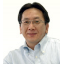
株式会社ジェムコ日本経営 上席執行役員