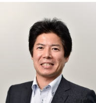
株式会社日通総合研究所 Advanced Technology Unit Unit Leader