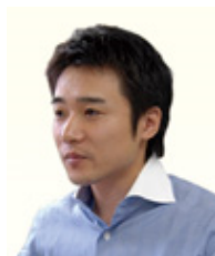
株式会社ジェムコ日本経営 コンサルティング事業部 部長コンサルタント